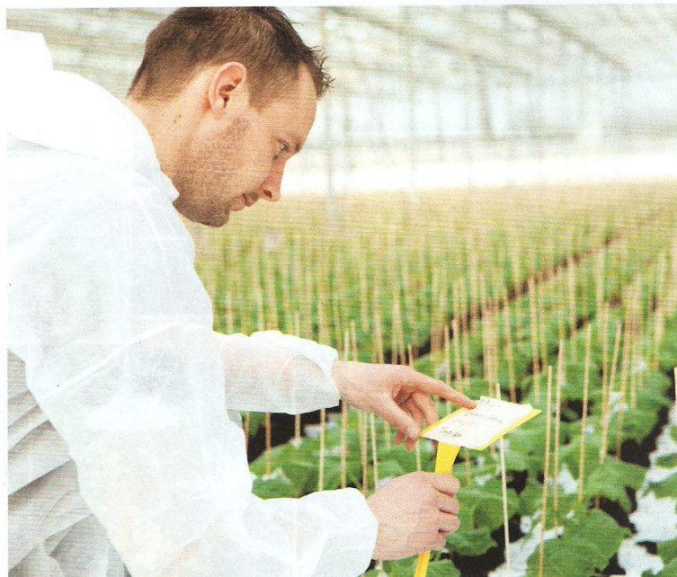
PICTUREWORLD / PHOTODIEM

Outra modalidade de negócio que tem sido bastante explorada pelas empresas é a produção terceirizada. Nesse caso, a empresa produtora de sementes responsabiliza-se por todas as etapas da produção de determinada cultivar, porém a semente, quando pronta, leva a marca comercial do obtentor e será comercializada por ele. Esses casos acontecem quando um